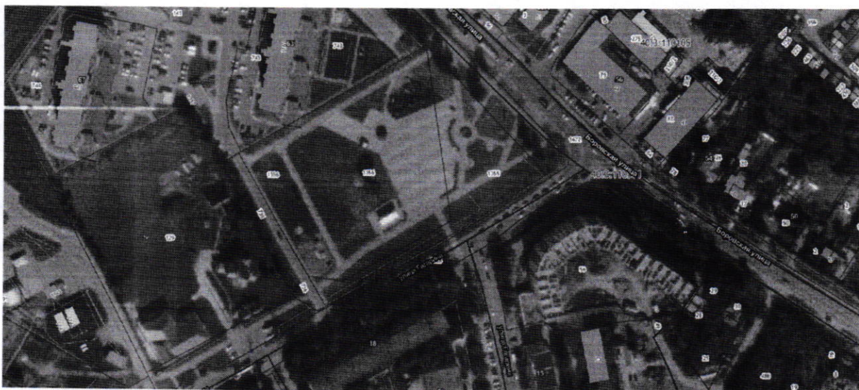
3. площадь у Дома культуры г. Балабаново